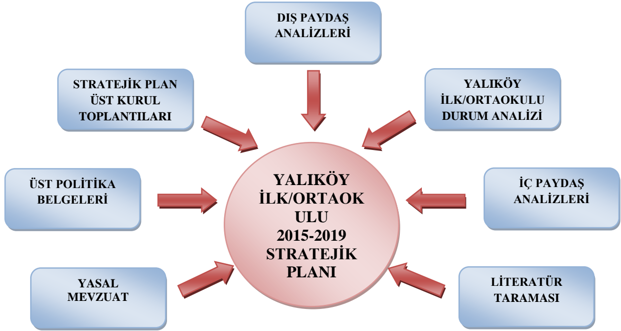
Şekil 2: Stratejik Plan Hazırlık Çalışmaları

İl Milli Eğitim Müdürlüğü Strateji Geliştirme Bölümü Ar-Ge Biriminin rehberliğinde okulumuzda görev yapan tüm personelin katılımı ve paydaşlarımızın beklentileri doğrultusunda kurumumuzun misyonuna ve vizyonuna uygun olarak okulumuzda Stratejik Plan çalışmaları başlamış ve öncelikle “Stratejik Plan Üst Kurulu” oluşturulmuştur. Daha sonra, plan hazırlıklarının tamamlanması, üst kurula belirli dönemlerde rapor sunmak ve üst kurulun önerileri doğrultusunda gerekli çalışmaları yürütmek üzere “Okul Stratejik Plan Ekibi” oluşturulmuştur.